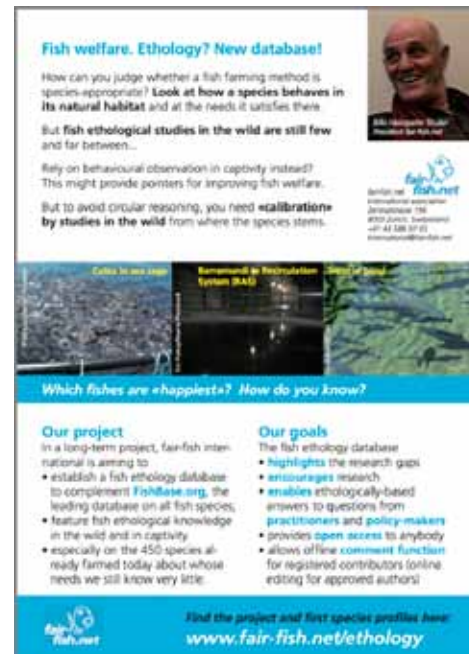
Unser Poster an zwei Kongressen

Im September verliess Filipa Saraiva Cunha das FishEthoBase-Team nach einjähriger Mitarbeit. Im Oktober schrieben wir die Stelle (25-50%) neu aus, unter anderem in der ersten Ausgabe unserer Zeitschrift «Scale» (siehe Seite 6). Die Bedingungen waren gezielt eng definiert, um die Zahl der Bewerbung auf mögliche Treffer zu reduzieren. Es lagen uns schliesslich zwölf definitive Bewerbun-