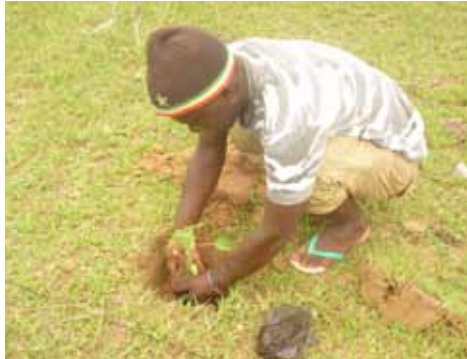
Pflanzung der ersten Obstbäumchen

Wie werden Schwerter zu Pflugscharen? So ähnlich heisst die Frage, auf die wir eine konkrete Antwort finden wollten: Wie werden Fischerdörfer wirtschaftlich unabhängiger vom Ertrag schwindender Ressourcen und vom unfairen Fischhandel? Wie entwickeln sie andere Einkommensquellen und schaffen so andere Perspektiven als ärmliche Fischerei oder Abwanderung?