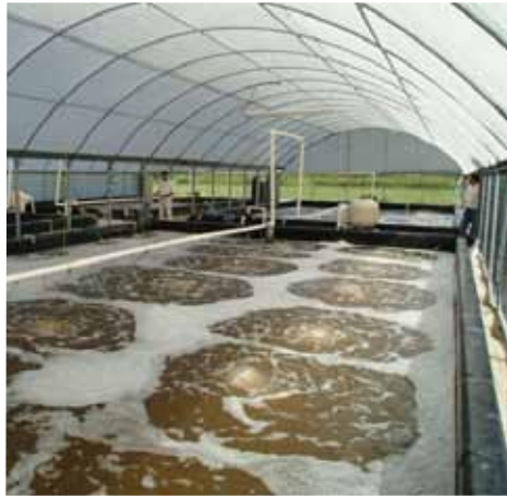
Shrimp-Zucht in den USA

Die Kosten des Projekts betragen bisher CHF 16506, darunter Honorare für den Präsidenten als Projektleiter (CHF 6095) und die beiden Projektmitarbeiterinnen (CHF 4560), für die Mittelbeschaffung (CHF 3110) und für Übersetzungen (CHF 1177). Kostenbeiträge für das Projekt sprachen die Stiftung Dreiklang (CHF 15000), die Elisabeth-Rentschler-Stiftung (CHF 2500) und die Rüegg-Bollinger-Stiftung (CHF 500). Die Swiss Alpine Fish AG honorierte ihren Auftrag für das ethologische Profil des Atlantiklachs (CHF 5000). Da die Arbeiten im Rahmen der verfügbaren Mittel vorangetrieben werden und der Beitrag der erstgenannten Stiftung gegen Ende des Geschäftsjahrs einging, stellten wir unaufgebrauchte Mittel im Umfang von CHF 6000 auf das folgende Geschäftsjahr zurück (siehe Bilanz) und weisen für das Berichtsjahr Projekteinnahmen von CHF 17000 aus.